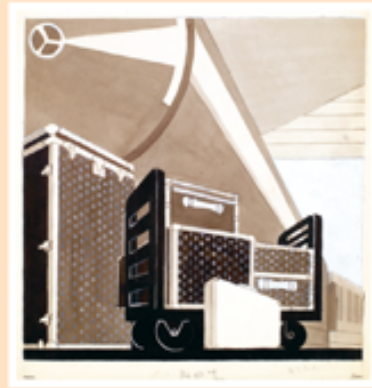
FIG. 10, 11, 12, 13