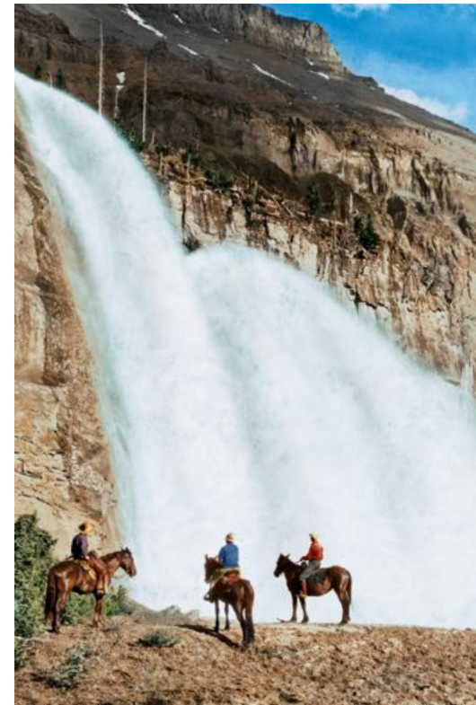
FIG. 77 Randonnée à cheval à Emperor Falls, dans le parc du Mont-Robson, Colombie-Britannique, Canada, début du XX e siècle.