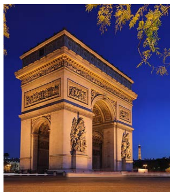
Arc de triomphe