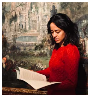
Musée Zadkine