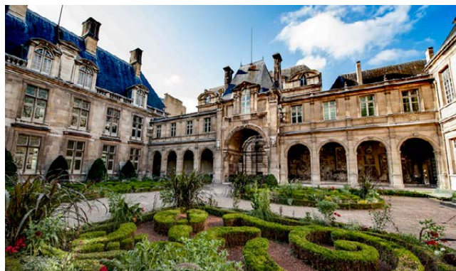
Musée Carnavalet