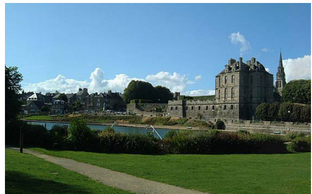
Panorama Château de Quintin Château