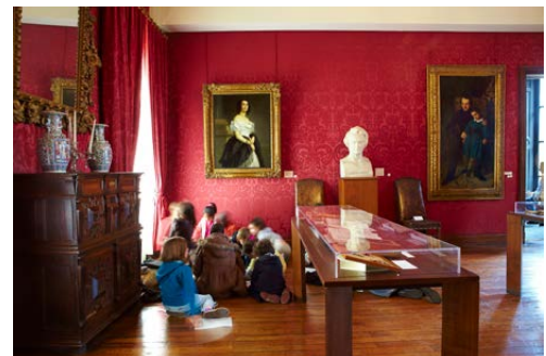
Maison de Victor Hugo