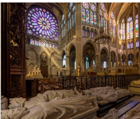
Basilique de Saint-Denis