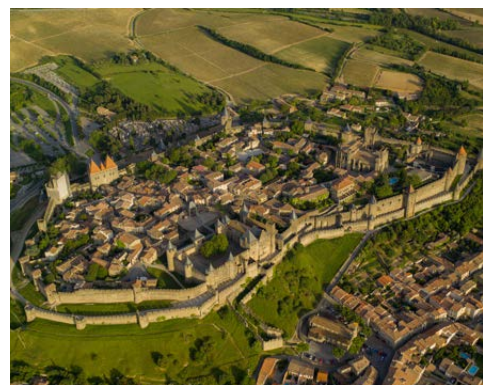
Cité de Carcassonne