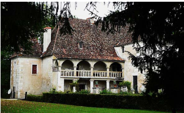
Château de Saint-Germain-du-Salembre

Pour sa 9 e édition placée sous le signe des patrimoines, l'association s'unit aux Nuits de la lecture et proposera des animations partout en France : en Bretagne au château de Quintin une murder party sera organisée, en Nouvelle-Aquitaine, au château de Montautre , un historien spécialiste initiera le public à la paléographie et au déchiffrement de parchemins, au château de Saint-Germain-du-Salembre , une lecture à deux voix de l'œuvre d'Eugène Le Roy, Jacquou le Croquant , sera proposée ou encore en Centre-Val-de-Loire, dans le château de Thol, le public pourra reconstruire le dessinateur de bande dessinée, Josselin Duparcmeur et une lecture de contes.