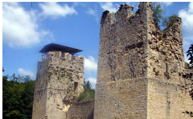
Château de Thol