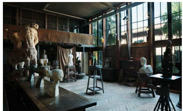
Musée Bourdelle